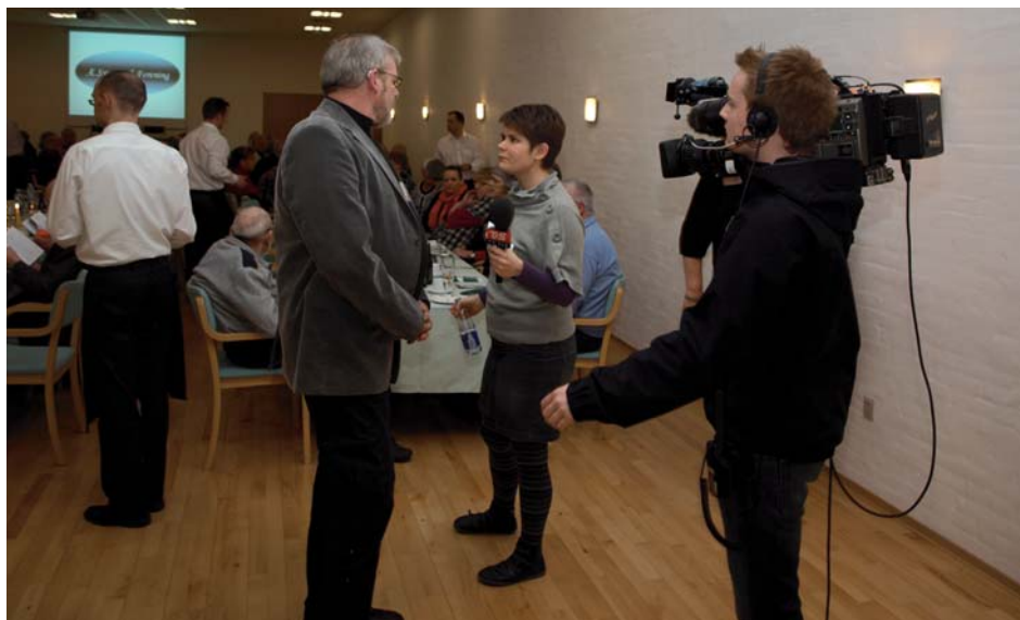
Æ formann interviewes direct i TV-Syd.