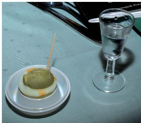
Solæch å snaps, som hø tæ æ generalforsamling