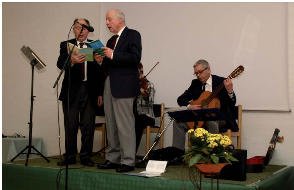
Ront á æ goll, som unneholt.