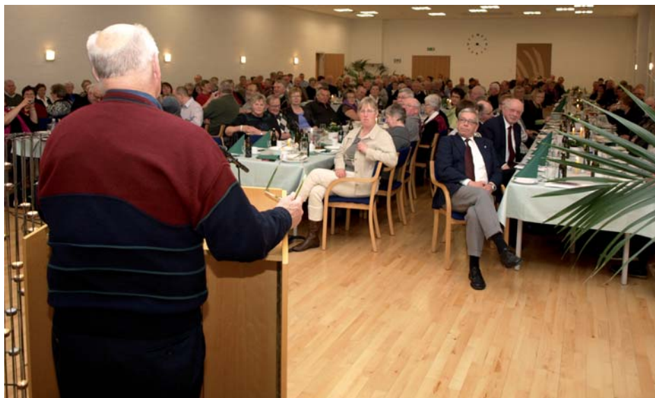
Vagn unneholt æ hele sal, me sin historie.